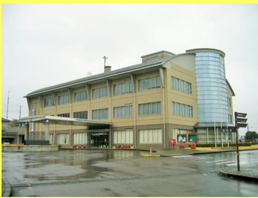
御浜町地域包括支援センターは、御浜町役場庁舎の1階にあります。